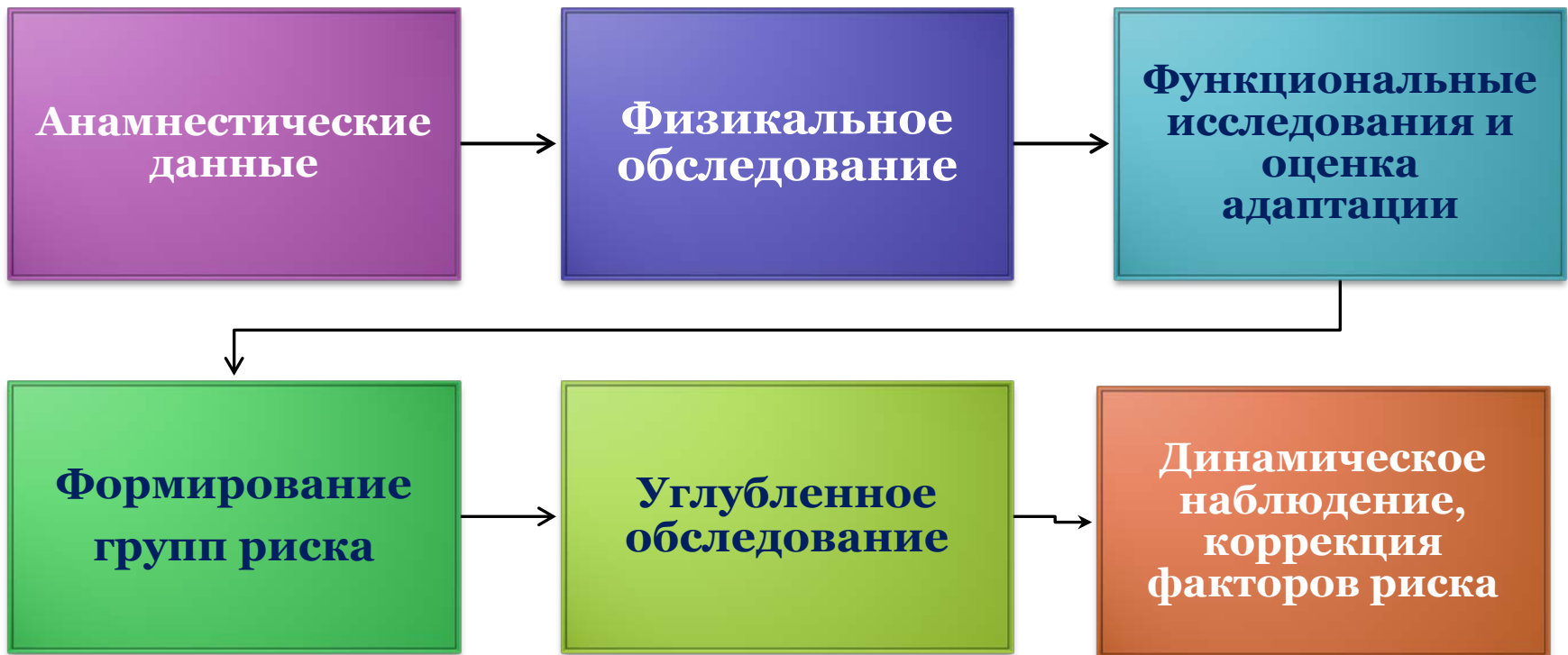
Схема проведения скринингового этапа врачебной профессиональной консультации подростков с ДСТ