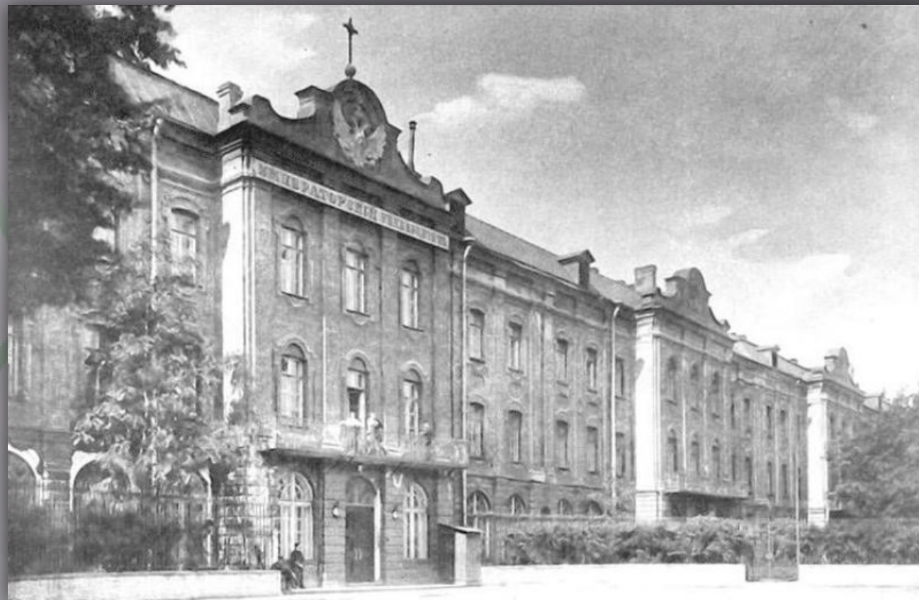
Санкт-Петербургский государственный университет (год основания – 1724)