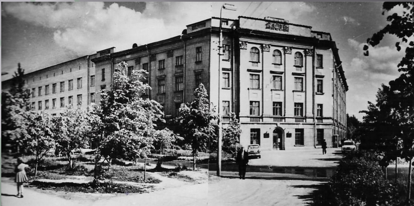
Здание ФГБНУ «НИИ медицины труда» (Москва, Проспект Будённого, 31)