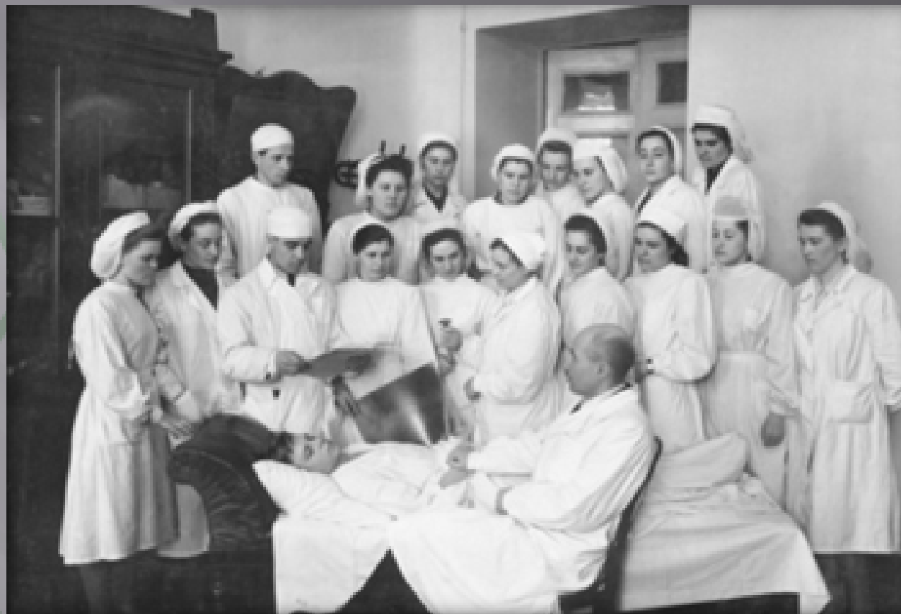
Первое заседание студенческого кружка в 1928 году кафедры социальной гигиены медицинского факультета Томского государственного университета (ныне - Сибирского ГМУ).