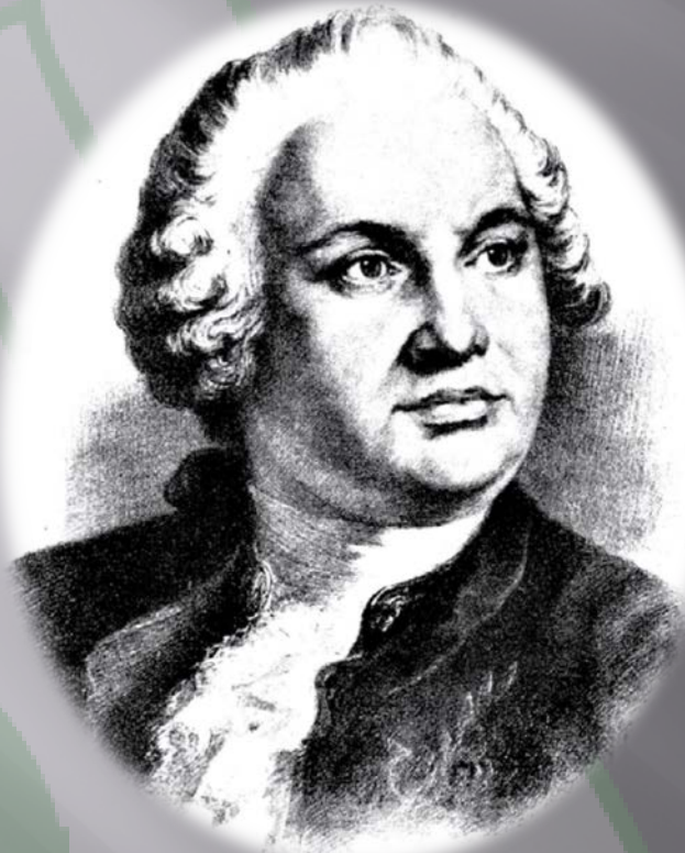
Михаил Васильевич ЛОМОНОСОВ (1711-1765)