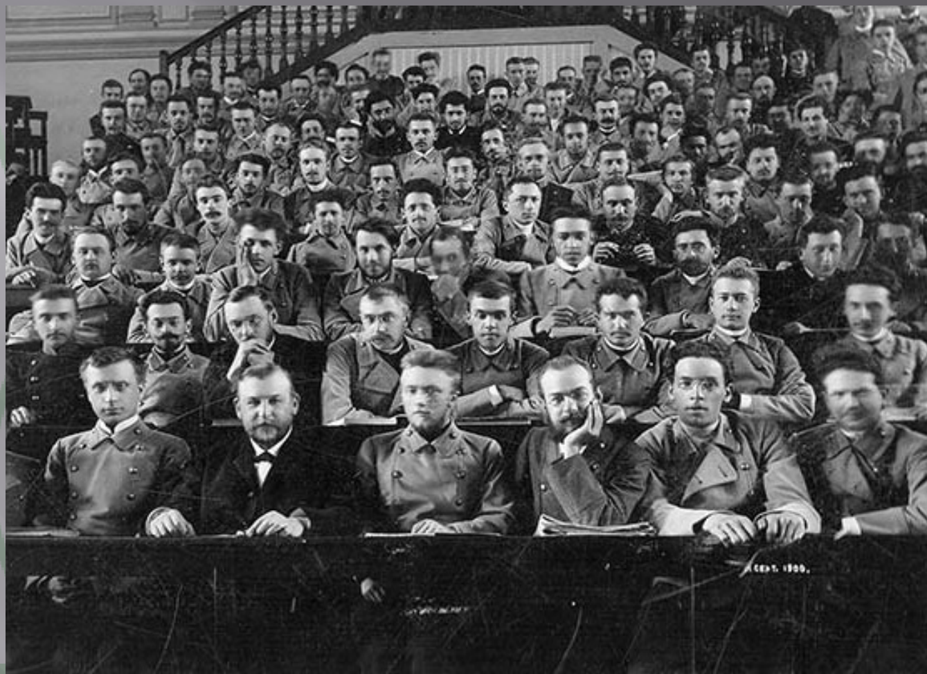
Студенты и вольнослушатели Императорского Санкт-Петербургского университета в Большой аудитории (1900 г.)