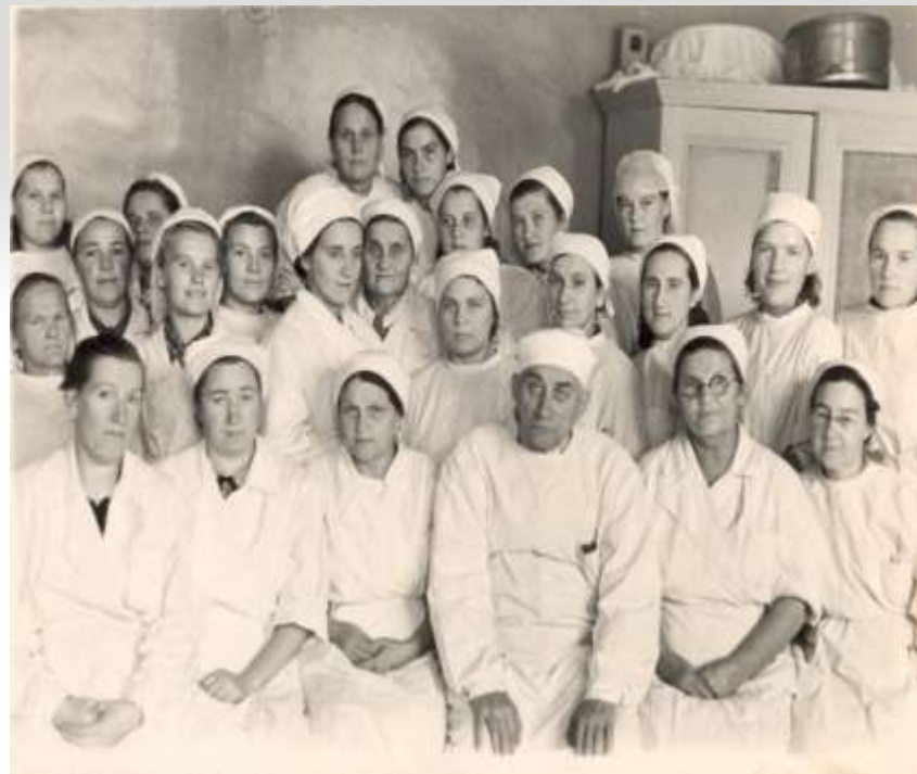
Коллектив Дорожной клинической больницы на станции Ярославль, 40-е годы 20 века

В 2003 году при акционировании железных дорог России железнодорожная медицина вошла в состав ОАО «РЖД»